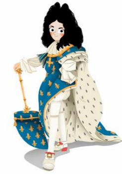
Louis XIV 1643 - 1715

1150 1200 1250 1300 1350 1400 1450 1500 1550 1600 1650 1700