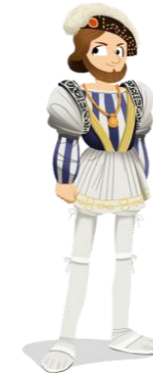
François 1 er 1515 - 1545