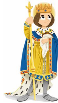
LOUIS IX 1226 - 1270