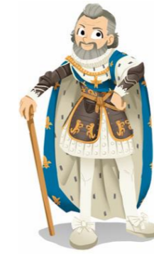
Henry IV 1589 - 1610