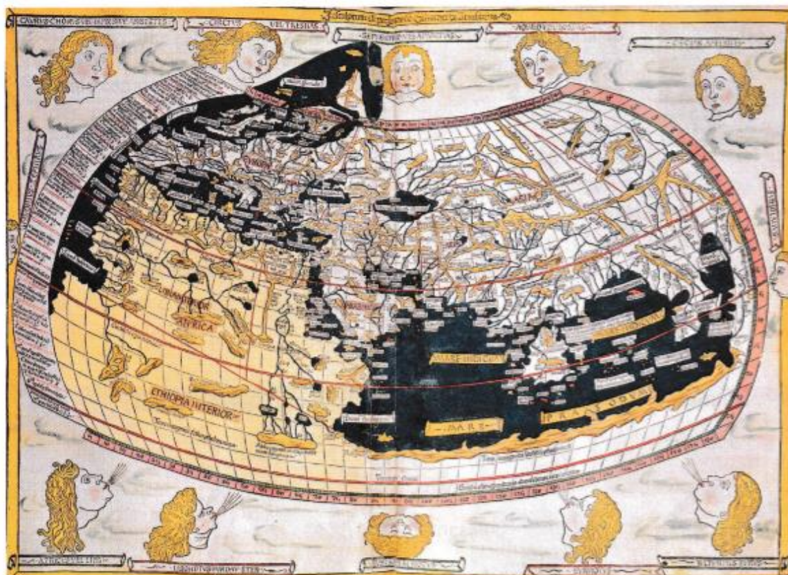
Carte du monde de Nicolaus Germanus, 1482 (British Library, Londres, Grande-Bretagne).